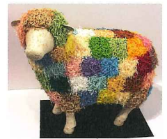
眠れぬ夜は羊を数える