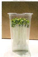
フェイクいわれ・1パック39円