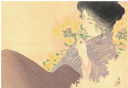
梶田半古 菊のかをり