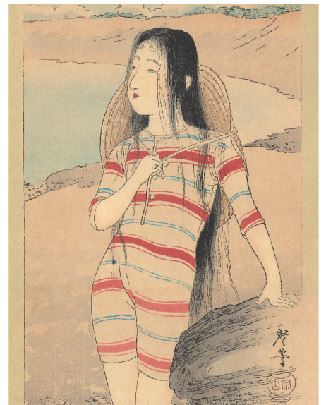
寺崎広業 美人の海水浴