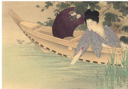
武内桂舟 湖心の誓