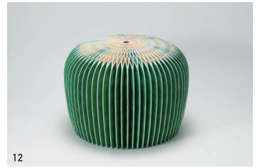
1 かわにくつ 2 フェイクかわれ・1パック 39円 3 眠れぬ夜は羊を数える 4 Box 5 "Humu humu-Nuku nuku-A-Puaa" 6 考える筆たち 7 思わず「ふうーっ」としたくなる 8 茶碗二点 9 Pay Per Paper 10 生命 11 海にとける月 12 サボテン