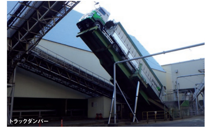
トラックダンパー