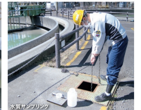
水質サンプリング