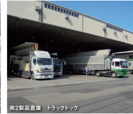
南2製品倉庫 トラックドック