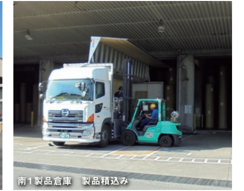
南1製品倉庫 製品積み込み