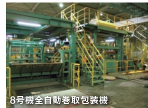
8号機全自動巻取包装機

重機・リフト 85台(ホイールローダー、ショベルローダー、ブルドーザー、各種リフト) 機械・設備 8号機全自動巻取包装機、給油取扱所、リフト整備工場、ワインダー