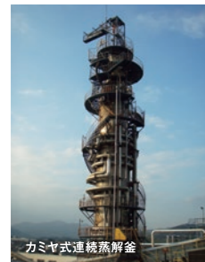
カミヤ式連続蒸解釜