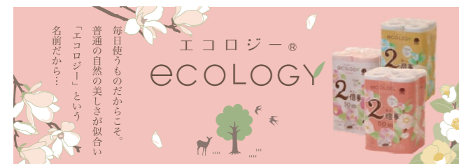
エコロジーシリーズ