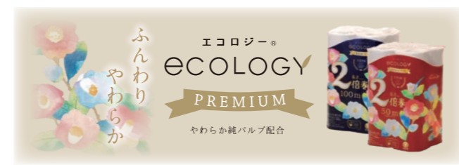
エコロジープレミアムシリーズ